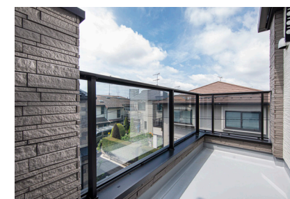
「バルコニー」当社施工例