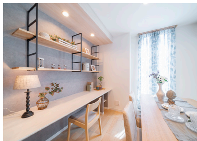
「ファミリーコーナー」当社施工例