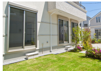
「芝張りの庭」当社施工例