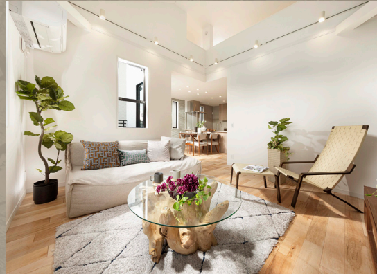
約4.0mの高天井が贅沢な開放感をもたらす「2階吹抜けリビング」