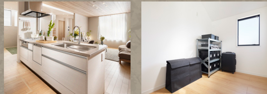
最高級のフィオレストーン天板の美しい「ペニンシュラキッチン」