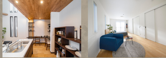
レシピ検索や趣味のスペースに使える「キッチンラボ」