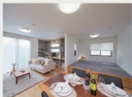
1 和の寛ぎが愉しめる 下部収納付き「タタミコーナー」