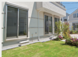
2 多彩なアウトドアライフが 楽しめる「芝張りの庭」