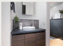
6 帰宅して直ぐに手洗いが できる「ただいま手洗い」