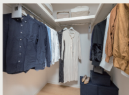
4 中に入ってお洋服が選べる 「ウォークインクローゼット」