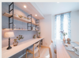
3 LDに棚とカウンターを設えた 「ファミリーコーナー」