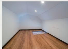
6 大容量の収納スペース「小屋裏収納」