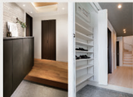
5 SICと下足入れを確保した大容量の「玄関ホール収納」