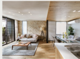
2 広々とした開放感が贅沢な「20畳超のリビング」