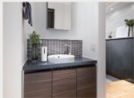
3 帰宅して直ぐに手洗いができる「ただいま手洗い」