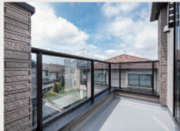
6 テーブルセットなども置ける「大型バルコニー」