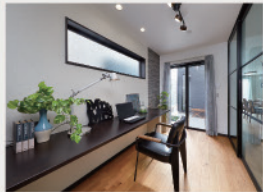
3 リビングと一体利用ができるテレワークに便利な「DEN」