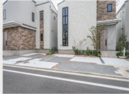
1 ゆとりと開放感をもたらす「2台カーポート」