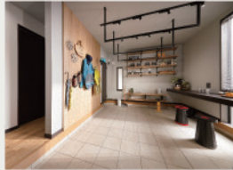
2 土間のような使い勝手が便利「サイクルポート」