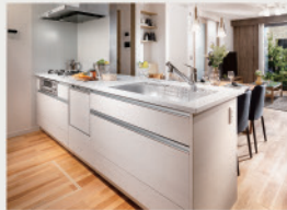
4 スタイリッシュで高級感ある「フラットキッチン」