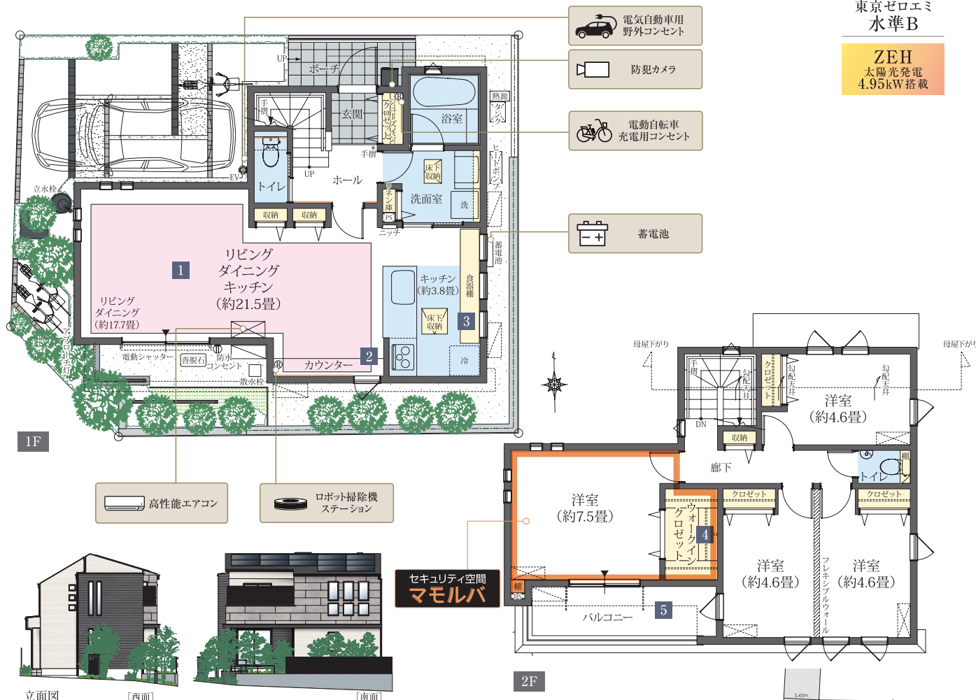
立面図 [西面] [南面]

ファミリーカウンターを配した1階リビング・ダイニング・キッチンや、2階の各居室に設えた収納が家族の豊かな暮らしを支える邸。